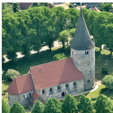
Sanierte Feldsteinkirche in Ratekau

Die im 12. Jahrhundert gebaute Vizelin-Kirche ist eine der ältesten christlichen Sakralbauten in Norddeutschland. Die 1156 errichtete Kirche war und ist ein bedeutender Ort für die kulturelle Begegnung in Ratekau. Die Stiftung fördert seit ihrer Gründung 2007 verschiedene Veranstaltungen sowie die Sanierung des Gebäudes.