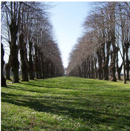
Die Allee im Barockgarten im Winter

Seit ihrer Gründung 2010 unterstützt die Sparkassen-Stiftung Barockgarten Jersbek den zwischen 1726-1740 angelegten Barockgarten finanziell über den Förderverein. Obwohl sich der Park im privaten Besitz befindet, ist er für die Öffentlichkeit frei zugänglich.