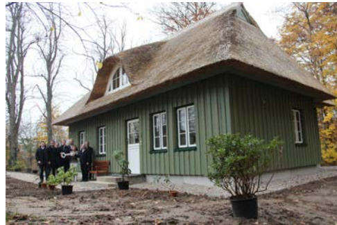
Schlüsselübergabe nach Fertigstellung

Sehr erfreulich war, dass die neue Pellet-Heizung (sowie der dazu erforderliche Lagertank) für das Hausmeistergebäude und das eigentliche Jagdschlösschen mit Mitteln aus der zuständigen Aktiv-Region gefördert wurden. Die Mittelauszahlung erfolgte in 2013.