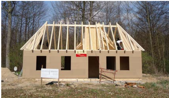
Ansicht des Rohbaus

Die beabsichtigten planerischen Vorhaben konnten in 2012 zwar vollständig umgesetzt werden. Nicht zu halten war die terminliche Planung. Statt Mitte 2012 konnte das neue Hausmeistergebäude erst Ende 2012 fertig gestellt werden. Auch der Einbau einer neuen Heizung für das neue Gebäude sowie für das Jagdschlösschen verzögerte sich.